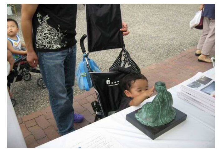
ボクも記憶力がよくなるように・・・