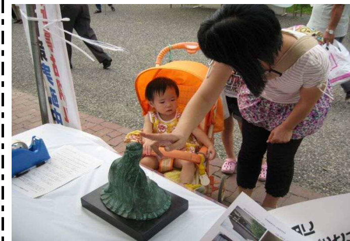
お母さんが銅像に触れて頭脳明晰を願います

平成23年9月11日（日）に本庄市総合公園周辺において「本庄市ふれ愛夏祭」が開催されました。このお祭りは施設や地域のお年寄り、身障害者、ボランティアなどの創造作品を出品展示、即売することで創作意欲と生きがいを高め、障害者の社会参加の場を拡大することを目的としています。顕彰会も参加して銅像やパネル展示の出品の他、まんが本の販売、会員募集も行い、多くの来場者に先生の偉業をPRしました。