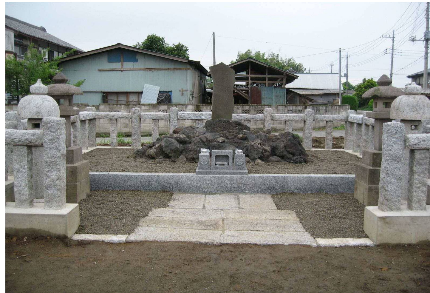
移転工事完成間近の塙先生墓所<本庄市児玉町保木野322番地>

※点訳ボランティアグループ「ほきの六点会」の皆様により会報誌の点字翻訳版を作成していただきました。ご希望の方は、事務局までご連絡ください。