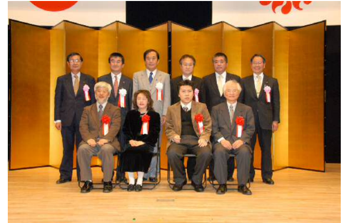
塙保己一賞表彰式の記念写真