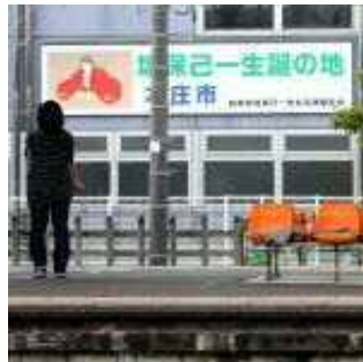
本庄駅南口駐輪場