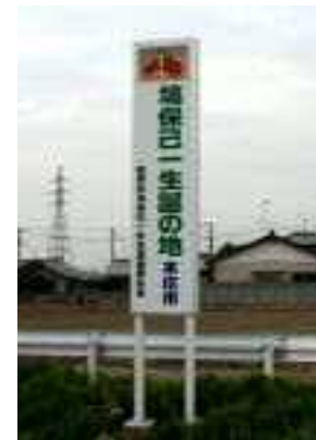
国道462号 伊勢崎から