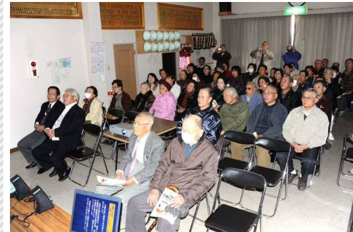
長浜町自治会 (児玉)

顕彰会では事業部会委員の中から講師グループを組織し、会議を何度も重ねてスライドの講座資料を作成しました。出前講座には講師グループが2人1組で4組の班を編成して交代で講師を務め、すでに6回実施しております。今後も地域の自治会で開催される時には是非ご参加ください。また、自治会に限らず事業所や各種団体などで開催する講座へも講師を派遣できますので、希望がありましたら事務局へご連絡下さい。講師料は無料です。