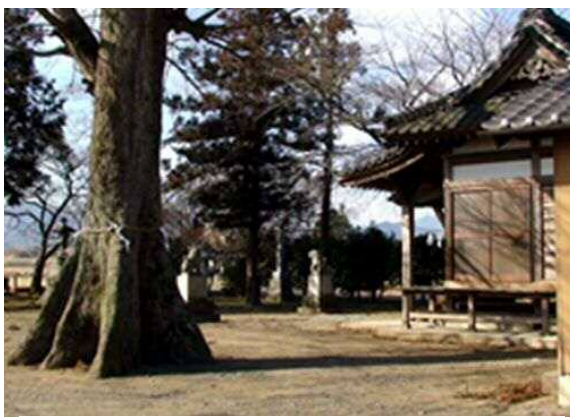
ひっそりとたたずむ御霊稲荷神社 (元の福泉院) <本庄市児玉町保木野314>