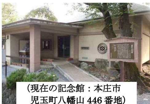
(現在の記念館：本庄市 児玉町八幡山 446番地)

(現在の記念館は、開館 9:00~16:30 月曜定休、入場無料 TEL0495-72-6032)