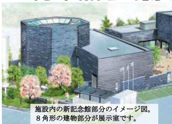
施設内の新記念館部分のイメージ図。 8角形の建物部分が展示室です。

本庄市では、現在、児玉総合支所跡地に新しい複合施設の建設を行っています。この複合施設内に塙保己一記念館が移転、新築となり平成27年6月上旬に開館する予定です。(同敷地内の児玉総合支所・児玉公民館・児童館は同年5月上旬開館予定。)