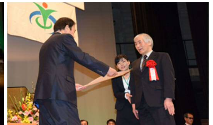
第10回塙保己一賞の様子並びに市民による群読劇「塙保己一物語」公演の様子