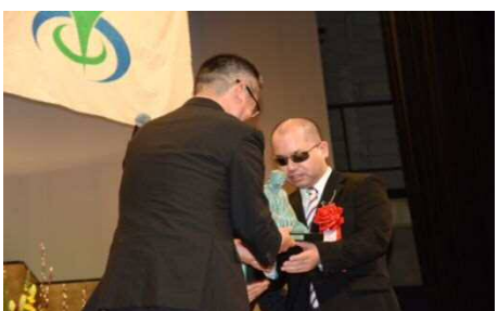
市長から副賞を授与

十二月二十日、セルディで行われた埼玉県主催・本庄市共催による塙保己一賞への協力をいたしました。当日は、障害がありながら社会的に顕著な活動をして