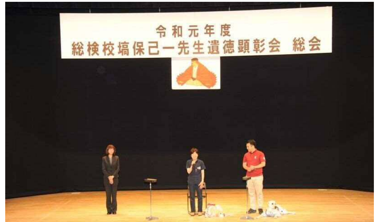
顕彰会総会にて盲導犬協会の職員（右）とユーザー（中央）の方が、盲導犬との生活や訓練の様子を語りました。