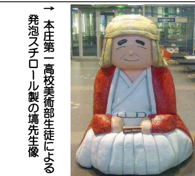
→ 本庄第一高校美術部生徒による発泡スチロール製の塙先生像

会場の若泉公園グラウンドには雨天にもかかわらず親子連れなど130人が来場し、様々な催しを楽しみました。