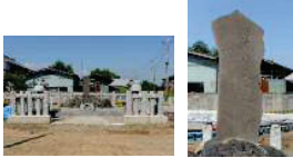
墓所全景 墓頭石大

塙保己一は、文政4年(1821)9月12日76歳で逝去し、四ツ谷の安楽寺に埋葬されました。明治19年に萩野茂重助が安楽寺の墳墓の土を持ち帰り、萩野家の墓地の南西隅に埋葬しましたが、明治44年児玉郡教育会が主となって、正四位贈位奉告祭並びに没後90年祭の時に萩野家の墓地の東に移転し、保己一の孫の忠告が持参した法衣を瓶に収め墓石に埋葬開眼しました。その墓所も、100年以上経過し、台石や外柵が老朽化し修繕が必要となったため、没後190周年記念事業として、墓所の安全保存のために、平成24年に塙保己一公園に移転しました。