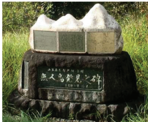
小笠原にある『無人島発見之碑』