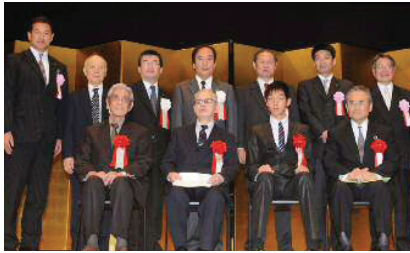
昨年の表彰式の様子

日時 12月20日(土) 午後1時～ (受付は0時30分 から) 会場 セルディ