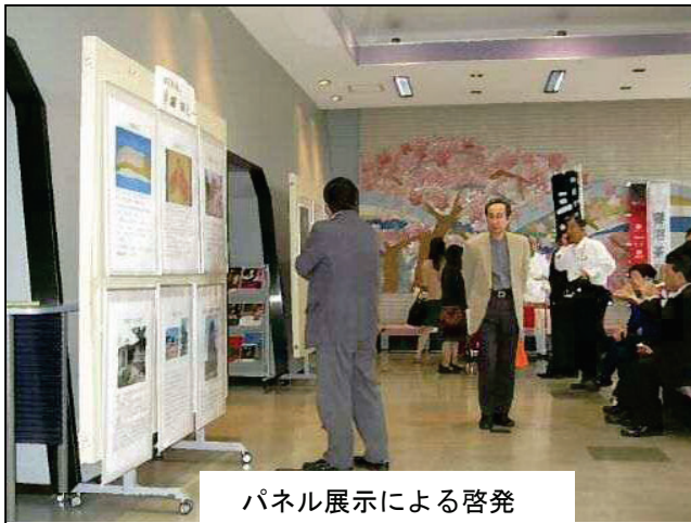
パネル展示による啓発