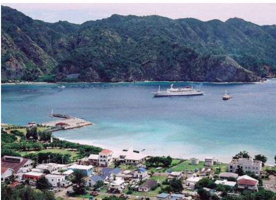
風光明媚な小笠原の島々

保己一が設立した和学講談所の 関係資料が列強の介入を辛うじて 防ぎ、国の承認を得、正式に日本の 領土となったのが、明治九年であり ました。