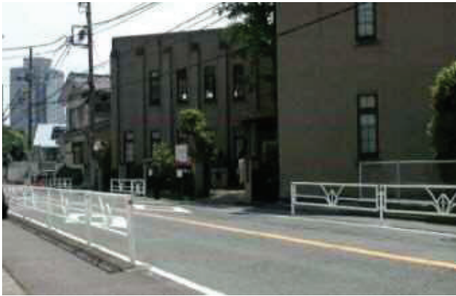
渋谷区の温故学会会館