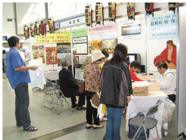
本庄市ブースの様子