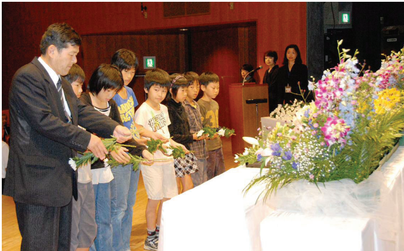
9月12日の遺徳顕彰祭で献花する金屋小学校の校長先生と児童