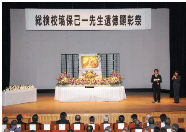
総検校塙保己一先生遺徳顕彰祭

総検校塙保己一先生遺徳顕彰会では、塙保己一先生の命日である9月12日に、本庄市児玉文化会館（セルディ）で遺徳顕彰祭を開催しました。