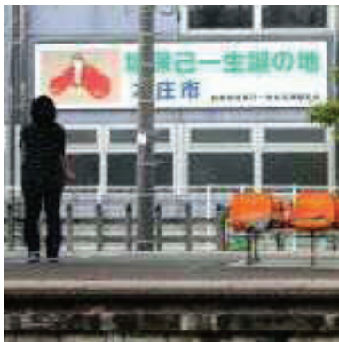
本庄駅南口駐輪場