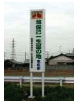
国道462号 伊勢崎から