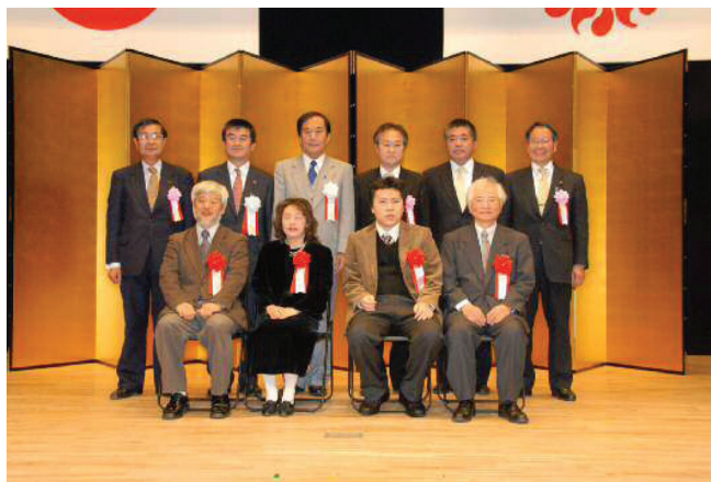
塙保己一賞表彰式の記念写真

郷土が生んだ塙保己一先生のように、障害がありながらも不屈の努力を続け顕著な活躍をしている方や、障害者のために様々な貢献をしている方を表彰するもので、本庄市も共催して副賞の「塙保己一先生ブロンズ像」を贈呈しています。総検校塙保己一先生遺徳顕彰会も微力ながら協力しております。